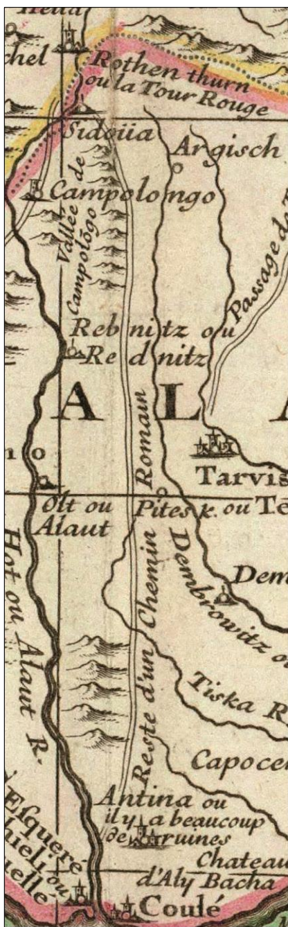
Figura 4. Harta Ungariei, de Guillaume Delisle. Detaliu cu reprezentarea zonei limesului transalutan.

Cea mai probabilă verigă de legătură între "observațiile" lui Marsigli și documentarea lui Delisle pentru harta Ungariei rămâne, în stadiul actual al cunoștințelor, Giovanni Domenico Cassini (1625-1712), bolognez ca și Marsigli, dar ajuns (în 1669) și naturalizat (din 1673) în Franța lui Ludovic al XIV-lea, unde va conduce observatorul astronomic de la curtea Regelui Soare. Fără îndoială că originea bologneză comună a contribuit din plin la strângerea relațiilor și colaborărilor pe plan științific dintre Marsigli și Cassini. Cei doi întrețineau încă din 1695-1696 o corespondență susținută despre exactitatea hărților, metodele cartografice și tehnicile observațiilor astronomice (Stoye 1994, 133-135). Din primăvara lui 1699, Marsigli devine oficial corespondentul lui Cassini la Academia Regală de Științe din Paris (Pinault Sørensen 2006, 199). Pe de altă parte, sunt de notorietate excelențele relații dintre Cassini și Delisle (Petto 2007, 102). Delisle a fost elevul preferat și totodată protejatul lui Cassini (Krokar 1997, image 5), așadar nu putem exclude probabilitatea ca unele dintre descoperirile și inovațiile lui Marsigli să-i fi fost furnizate lui Delisle chiar de către fostul său profesor.