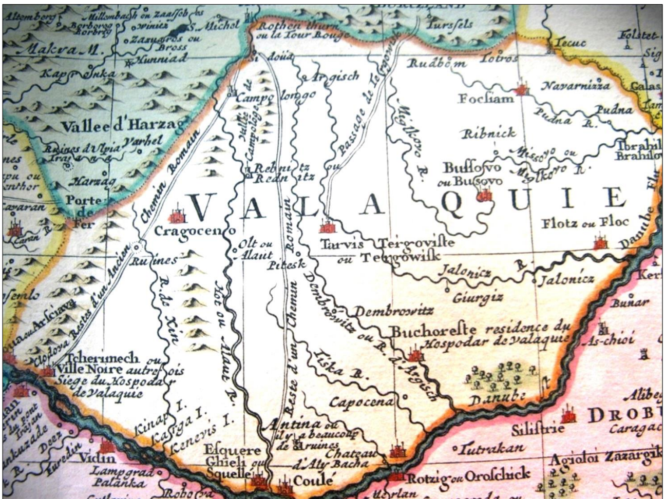
Figura 2. Harta Ungariei, de Guillaume Delisle, detaliu cu reprezentarea zonei Valahiei.

Dar harta lui Delisle era mult peste tot ceea ce se știa până atunci despre monumentele arheologice romane din Valahia. Vestigiile arheologice nu erau punctate disparat, ci alcătuiau un adevărat sistem, erau integrate unei concepții unitare de ansamblu, cu adevărat vizionare pentru primii ani ai sec. al XVIII-lea (Fig. 2). Harta prezintă jumătatea vestică a Valahiei străbătută de două drumuri romane, fiecare dintre ele marcat ca atare („Restes d'un Ancien Chemin Romain”) ce pornesc de la Dunăre, la mare distanță unul de celălalt, pentru a se întâlni în zona nordică a țării, aproape de hotarul cu Transilvania, într-un punct denumit „Sidoia” (evident, este vorba de castrul de la „Jidova”). Demn de remarcat, este prima apariție pe o hartă tipărită a acestui toponim arheologic ce marchează castrul de lângă Câmpulung.