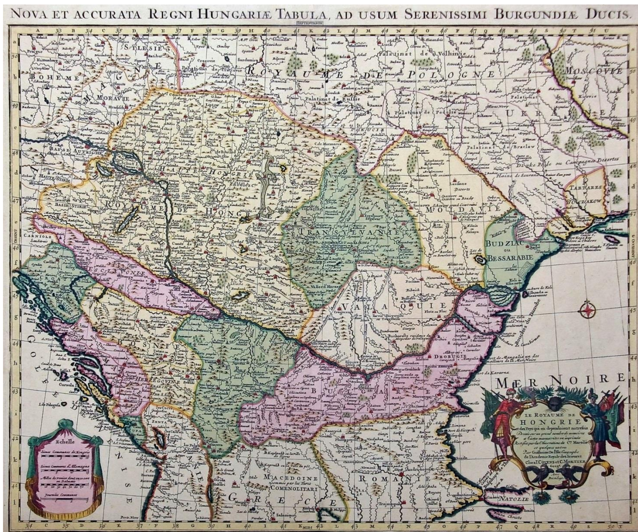
Figura 1 – Harta Ungariei, de Guillaume Delisle (Paris, 1703), ediția Johannes Covens și Cornelis Mortier (Amsterdam, circa 1740). Muzeul Județean Argeș, Colecția Aureliu Popescu, nr. inv. F/340/583.

Începând cu 1708, o nouă versiune a hărții (Szántai 1996, 145, Delisle 2), realizată cu o altă placă, ușor modificată în special în ceea ce privește cursul Tisei și Delta Dunării (Szántai 2004, 75-80), o dublează pe cea existentă pe piață deja din 1703.